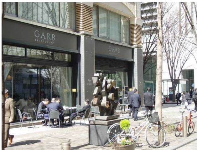
平日の昼も賑わう丸の内仲通り

環境を維持するための活動など、方法は随分と違っていても目に見えない努力が行われている。長い年月をかけて多くの人々の日々の努力によって積み重ねられるマネジメントが、複合機能によって成り立つ街の魅力を支えているのである。丸の内の仲通りが無味乾燥なオフィス街の街路からファッショナブルで賑わいのある通りへと変わったことでも、同じことが言えるだろう。