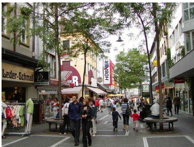
小さくても賑わう街(ドイツ/ダルムシュタット)

都市には住宅、店舗、オフィス、文化施設、工場など、様々な空間用途がある。一つの建物、街区、地区などの中で、様々な用途の空間を混在させることをミクスドユース(複合利用)という。近年の都市開発やまちづくりにおいては、この「ミクスドユース」という考え方が一つの常識となりつつある。観光などでヨーロッパの町を訪れた際、都市の規模は小さいのに街なかがとても賑わっていて、楽しい雰囲気にも包まれていることに驚いた経験をしたことがある人は少なくないだろう。レストランやカフェなどの店舗はもちろん、住宅やオフィスなどいろんな施設が寄り添うように街なか集まり、食事する人、仕事に道を急ぐ人、くつろぐ人などそれぞれに街と付き合う姿が見られ、活気づいている。都市開発などにおけるミクスドユースの活用は、このように長い歴史を重ねてその魅力を培ってきた姿を、現代の計画的なまちづくりの中で応用したものとも考えることもできる。